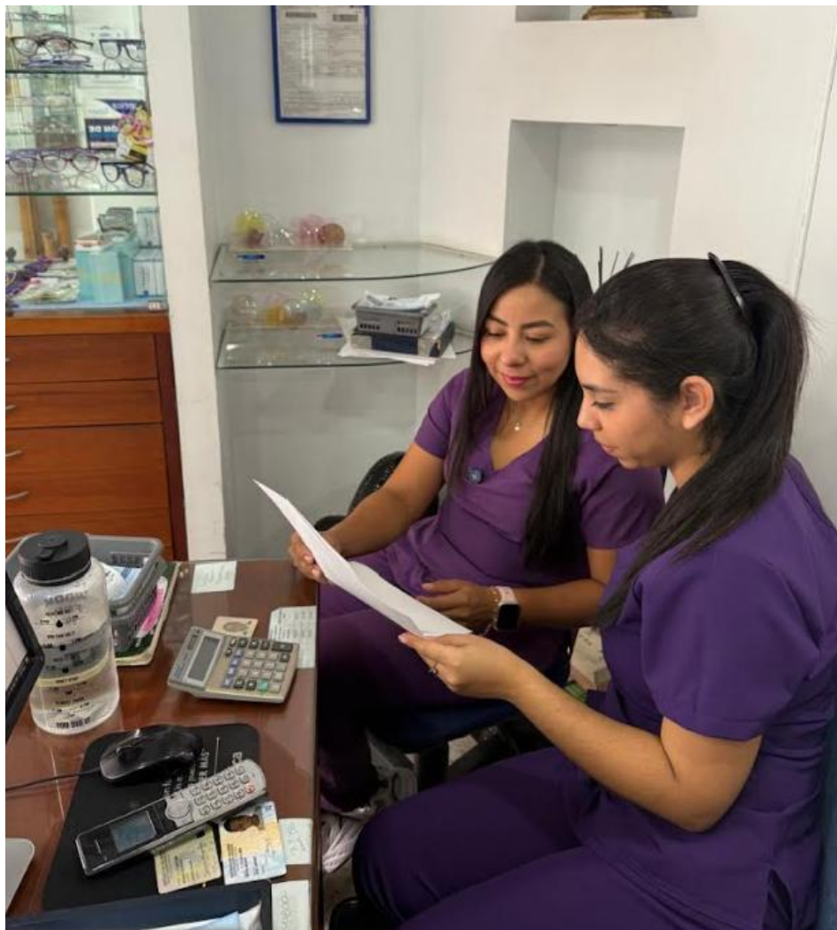
ANALISIS DE ENCUESTAS MES DE MAYO 2025